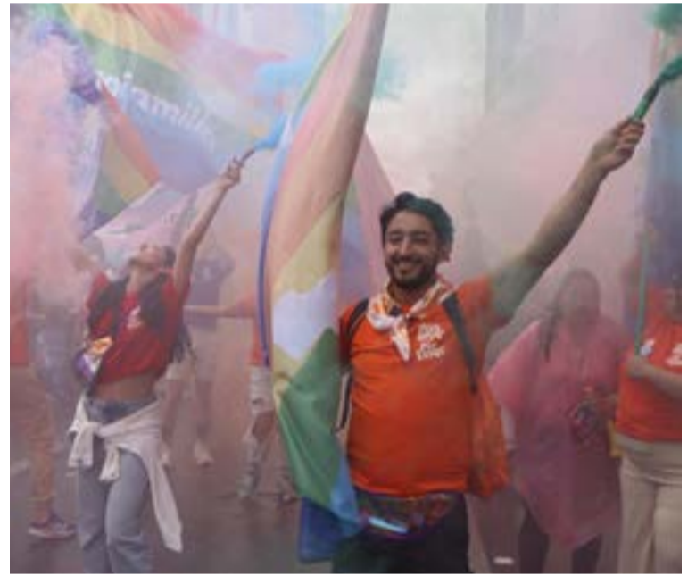
Un bloque civil marchó desde el Parque de los Hippies para sumar consignas en favor de la justicia social.