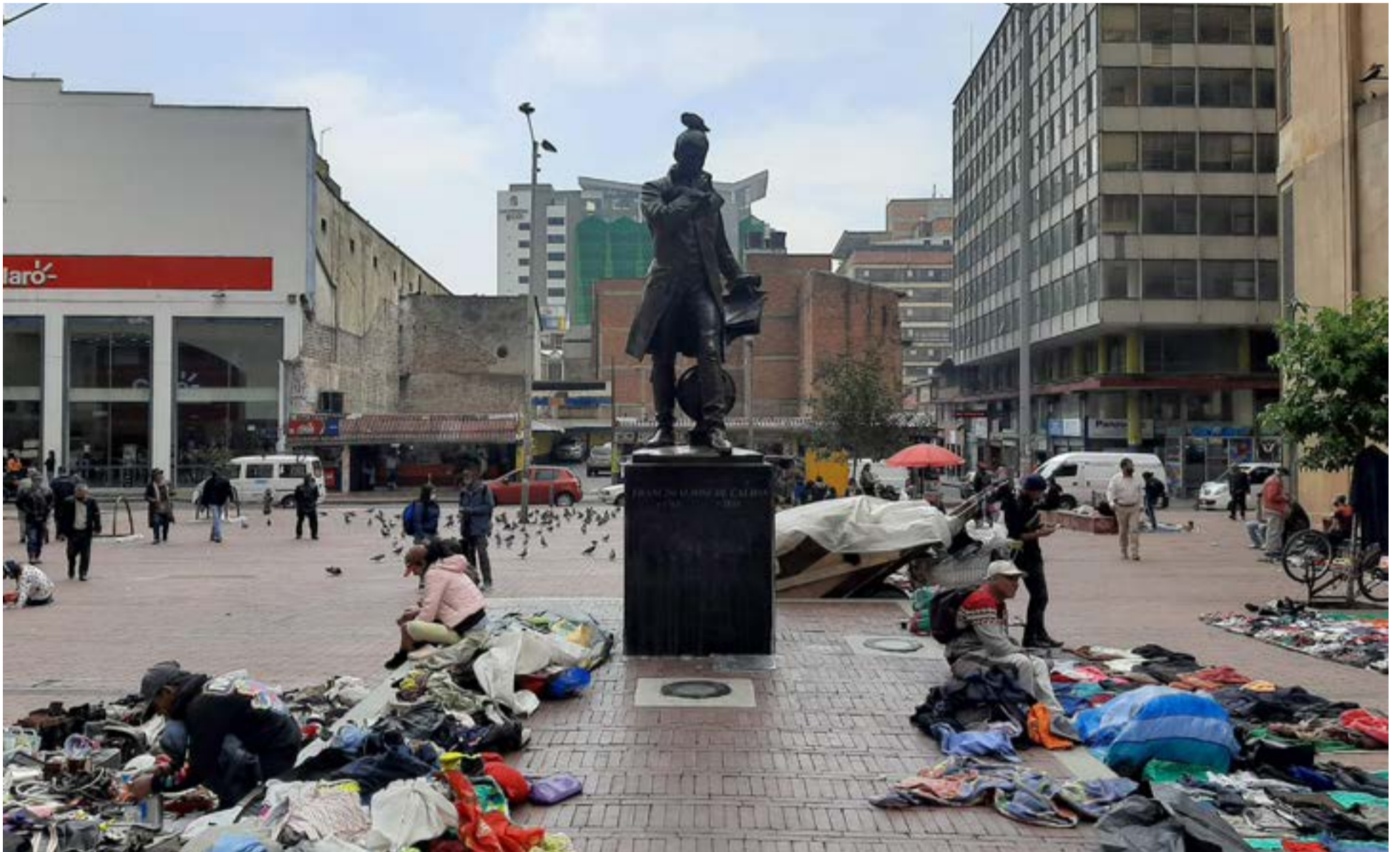
Estatua del sabio Francisco José de Caldas en la Plaza de las Nieves durante el día.