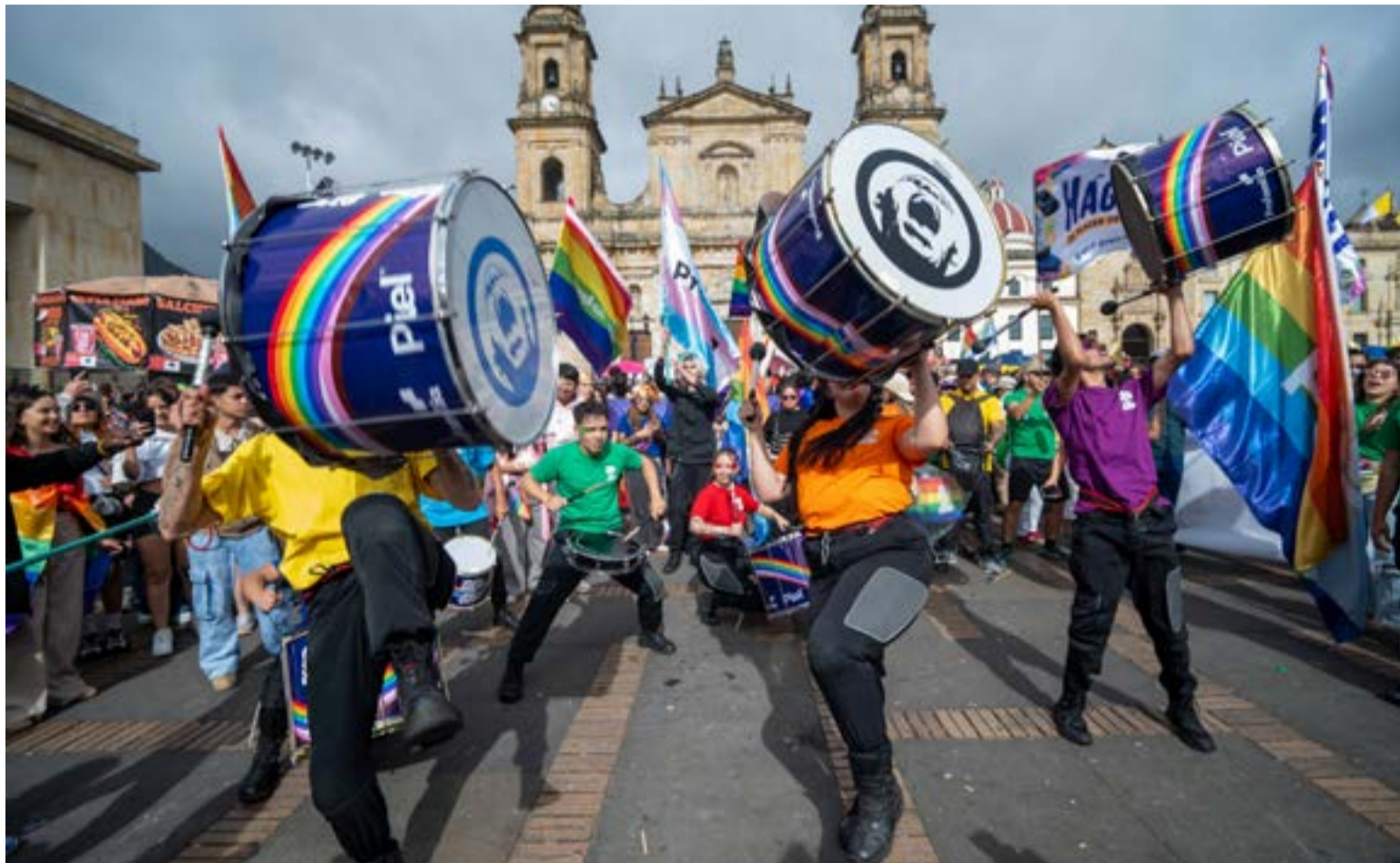
El masivo desfile avanzó por importantes arterias viales hasta desembocar con actos artísticos en la Plaza de Bolívar.

va reivindicación política frente a los retos de violencia y discriminación que aún padece esta población.