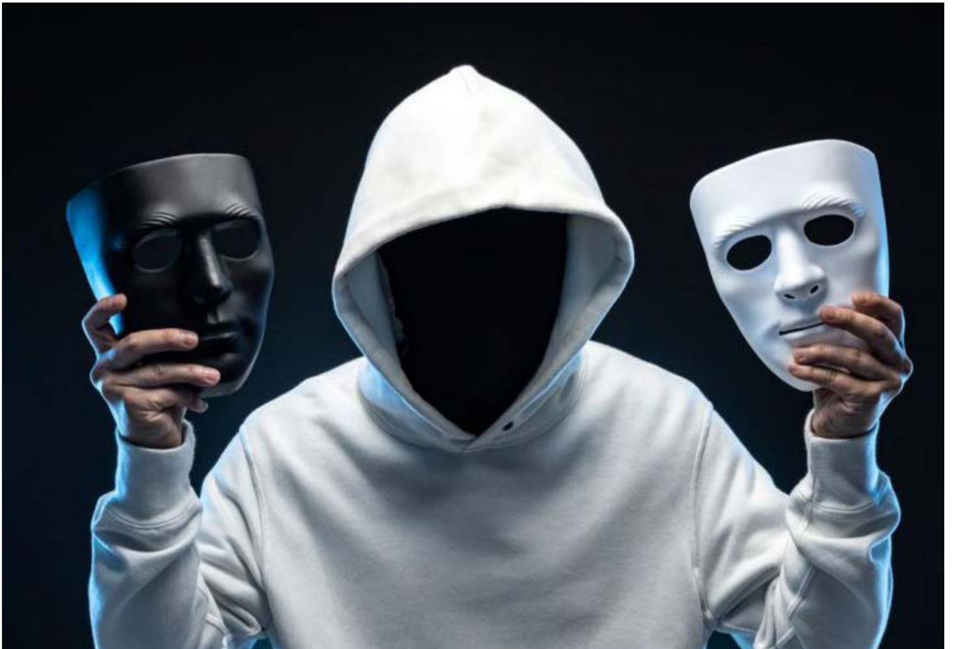
Las diversas caras que muestra los políticos a los electores