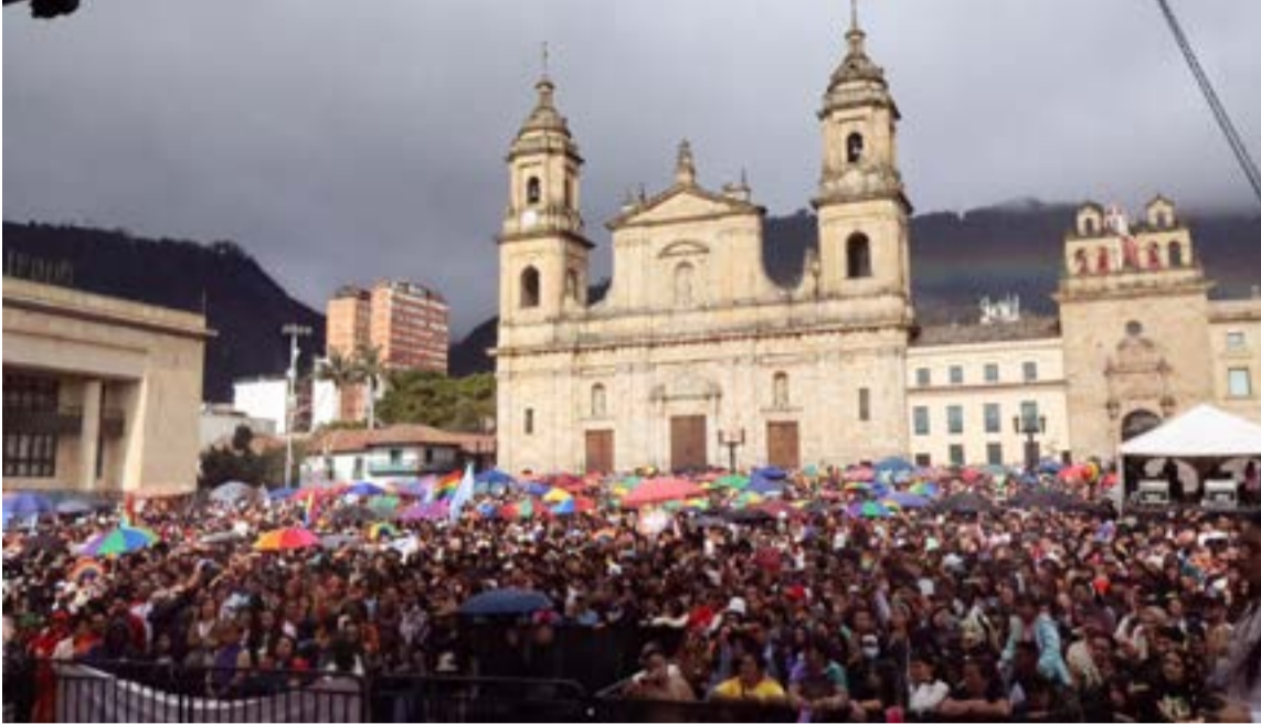
La movilización que llenó la Plaza de Bolívar hizo parte de la nutrida agenda del «Festival por la Igualdad 2026» coordinado por la Alcaldía Mayor.