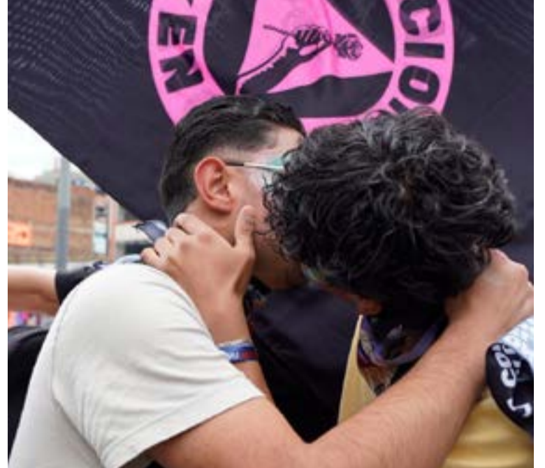
Marchantes recordaron la esencia de denuncia de la marcha frente al aumento de homicidios.