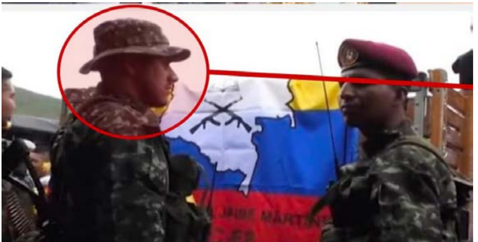
La Fuerza Pública dio de baja en el Cauca a alias 'Ñeque', hombre clave de 'Iván Mordisco' por quien EE. UU. ofrecía 5 millones de dólares. Tras el golpe, el presidente Gustavo Petro ordenó a los mandos militares y policiales una «ofensiva total» contra este grupo criminal.

«Hemos logrado derrotar a los dos principales jefes de las estructuras del llamado 'Iván Mordisco' en el Cauca. He dado una orden: ofensiva total contra el grupo armado más sanguinario del narcotráfico. Espero obediencia a todas las fuerzas militares y policiales», manifestó el jefe de Estado, enfatizando que «es el momento de la ofensiva final en el Cauca». Asi-