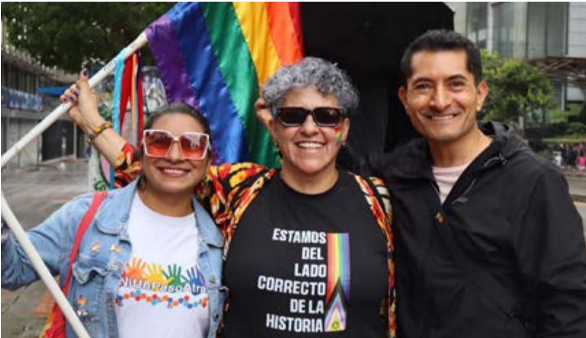
La gran Marcha Distrital consolidó a Bogotá como el epicentro de la diversidad y la inclusión en el país.